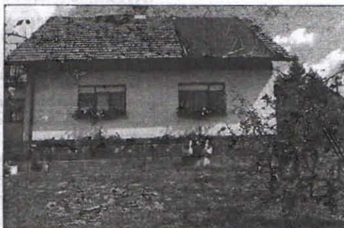
Skoraj polovica strehe je odkrita.