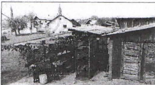
Tudi vrtno lopo in rože je toča povsem uničila.